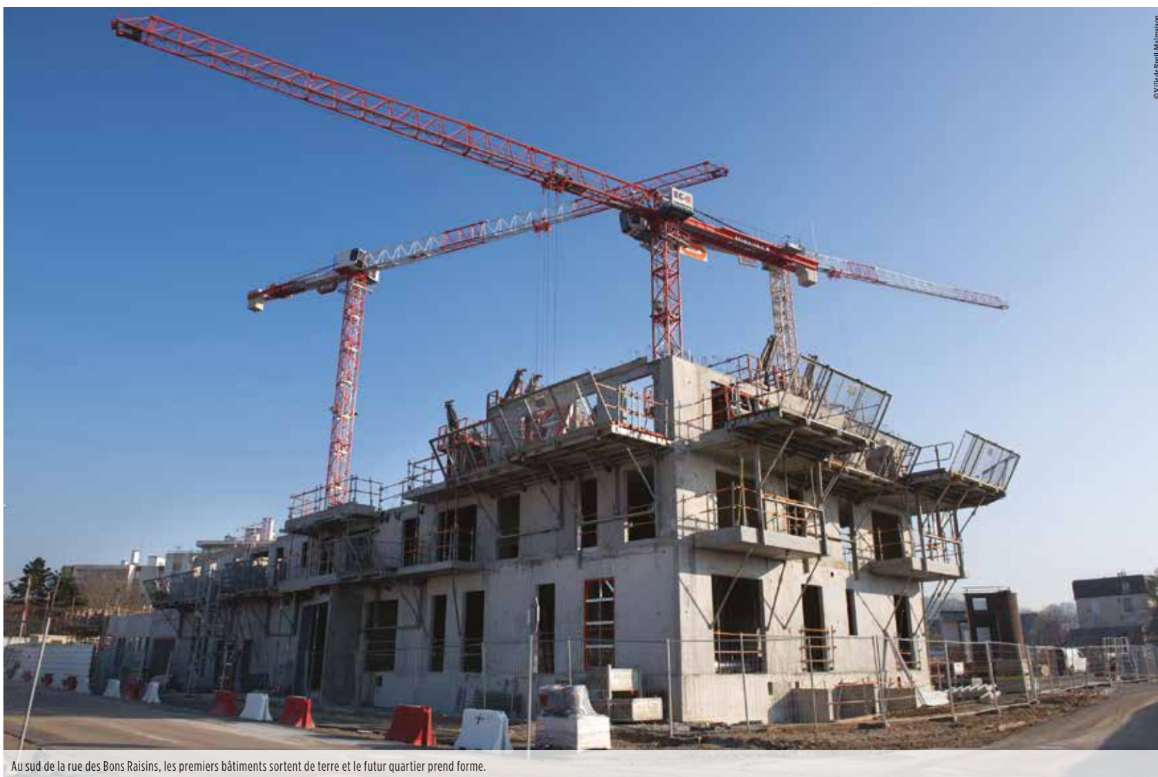
Au sud de la rue des Bons Raisins, les premiers bâtiments sortent de terre et le futur quartier prend forme.

Ce sont, enfin, deux pièces maîtresses du futur quartier que je me réjouis de voir émerger : tandis que le rythme auquel avance l'école Robespierre garantit une livraison de l'extension pour la prochaine rentrée scolaire, le nouveau complexe sportif ouvrira, quant à lui, ses portes en septembre 2020. Vous y découvrirez alors, sur 15 000 m 2 , un ensemble non seulement adapté à la pratique de nombreux sports, mais aussi performant sur le plan environnemental. Une complémentarité à l'image des objectifs que se fixe ce nouveau quartier que nous construisons ensemble.